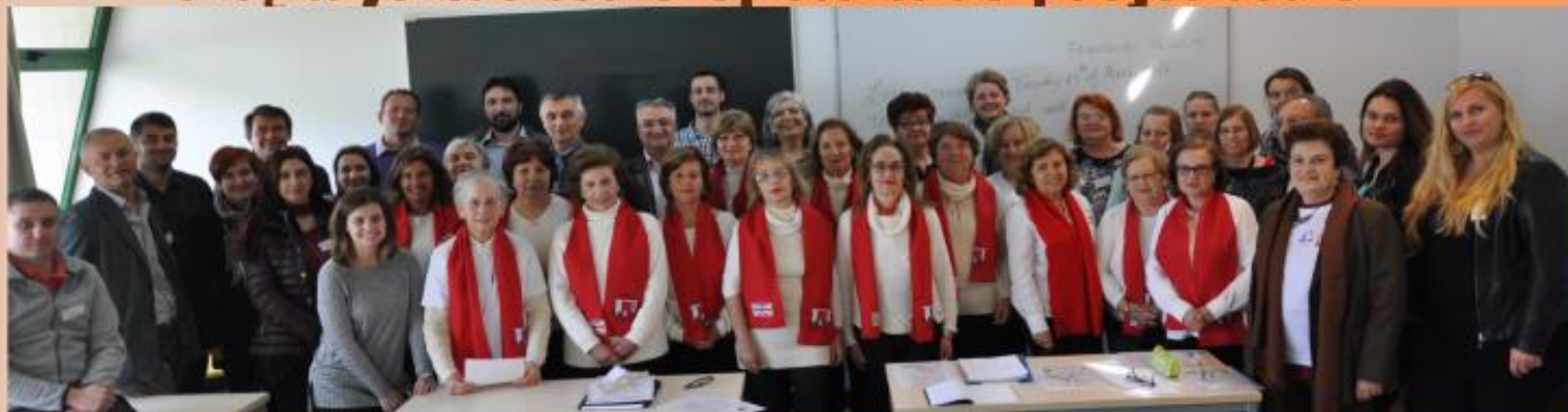
uczestnicy spotkania w Caldas da Rinha-Portugalia