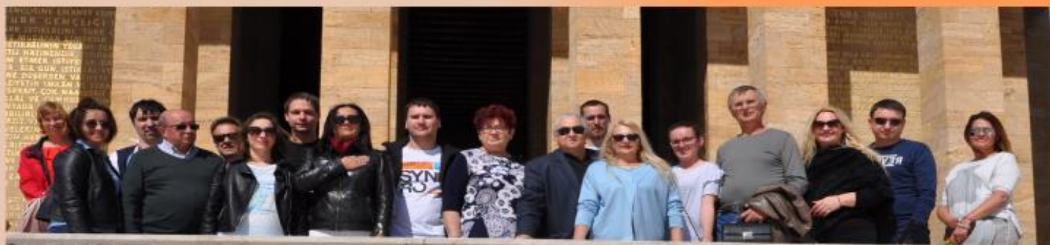
HAKİMİYET KAYITSIZ ŞARTSIZ MİLLETİNDİR Mauzoleum Atatürka-Anitkabir w Ankarze - Turcja