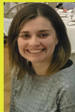
Gisele Janeiro Portugal